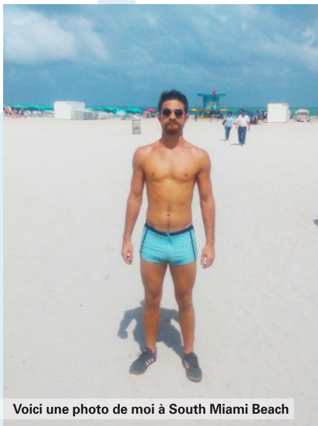
Voici une photo de moi à South Miami Beach

Les femmes aiment ça, les homosexuels aiment ça, les hommes hétérosexuels ne se soucient pas. Les seules personnes ayant un problème avec un homme portant un tel maillot sont des hommes qui s'inquiètent qu'ils soient gays. Outre ces mecs-là on est d'autant plus populaire plus on montre de la peau nue.