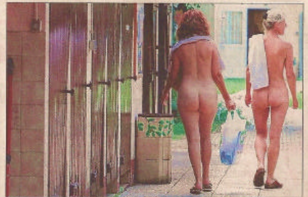
Les membres du Club du Soleil Mulhouse sont environ 200.

Initiée par ses parents, qui ont participé à la construction du site de Réguisheim il y a 41 ans (homme collectif, piscine, aire de jeux, boudrome...), Odile a grandi « naturiste ». Source de bien-être pour elle et ses deux enfants, cet art de vivre est aussi une échappa-